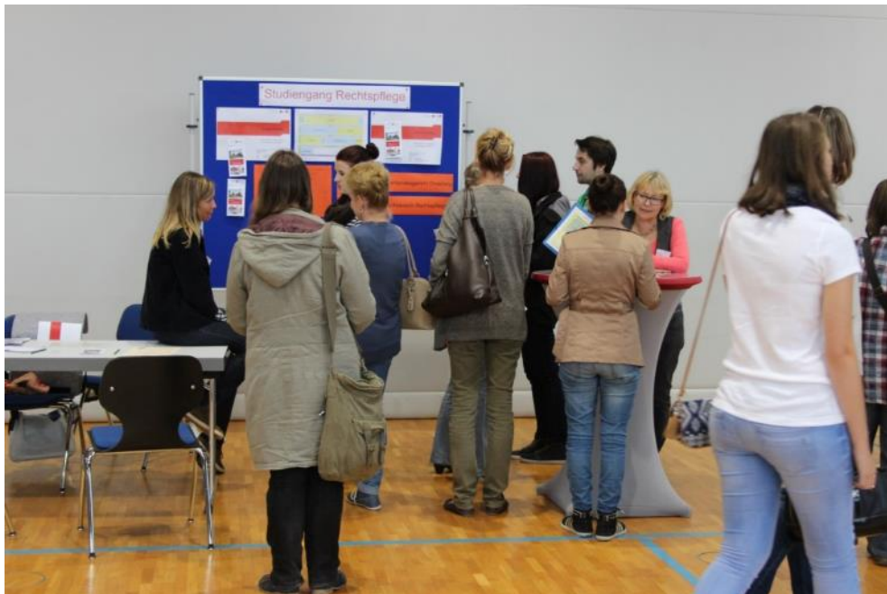
Abbildung 7 Studienmesse