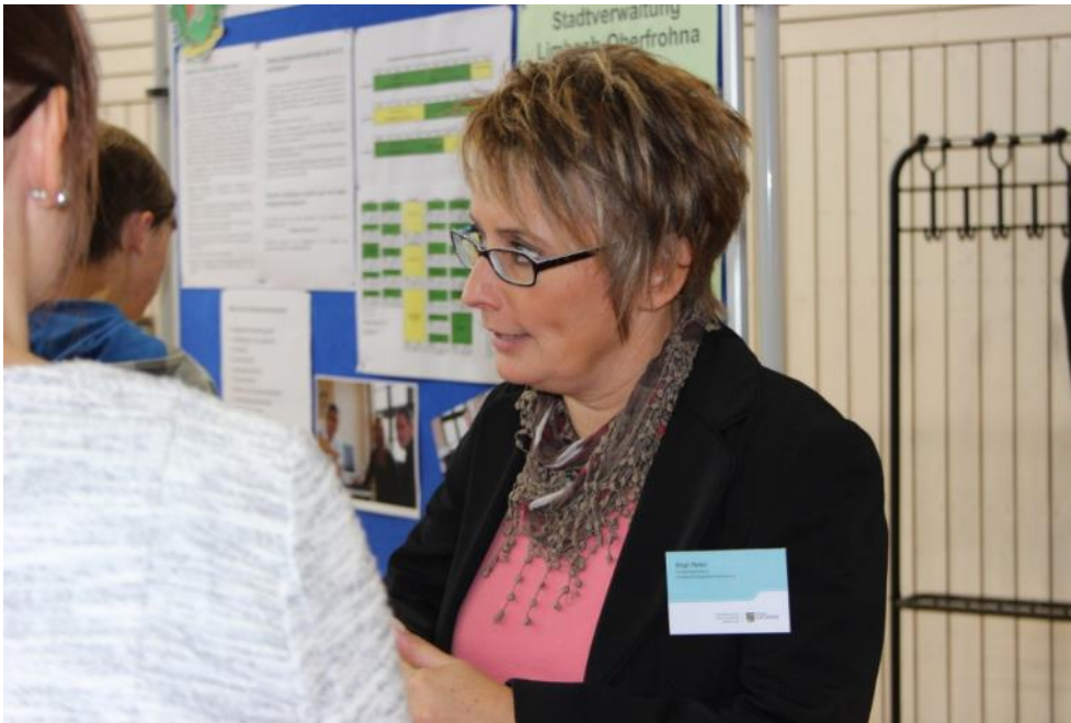
Abbildung 5 Studienmesse