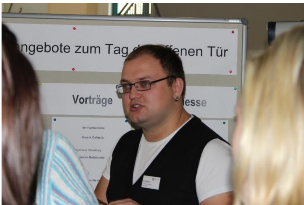
Abbildung 8 Beratung am Stand der Studenten