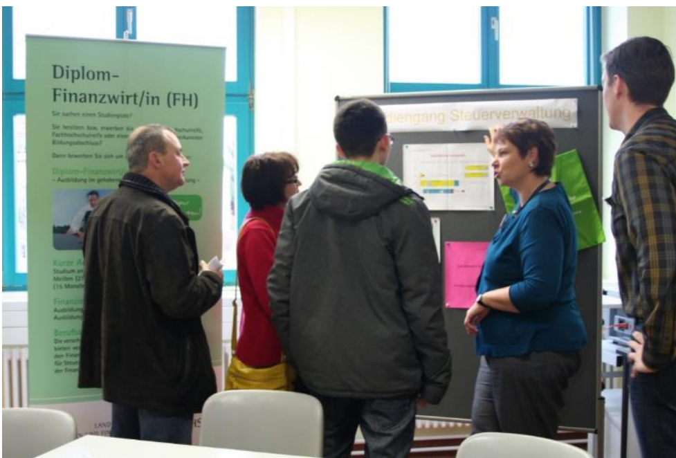
Abbildung 6 Studienmesse