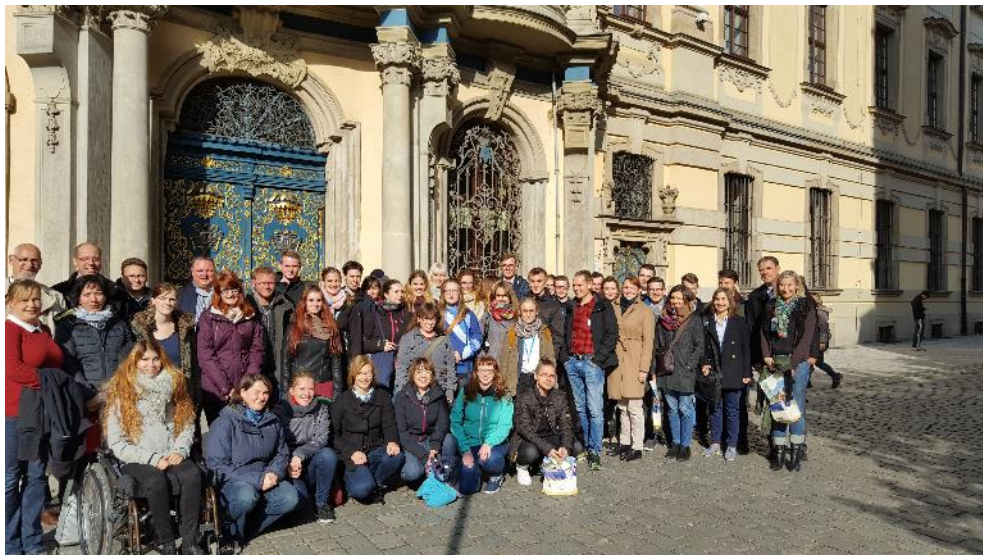
Abbildung 1 Interkultureller Studentenaustausch

Neben wissenschaftlichen Erkenntnissen, interkulturellen Erfahrungen und neuen Kontakten nehmen die Teilnehmer der Reise vor allem den Eindruck einer überwältigenden Gastfreundschaft unserer polnischen Gastgeber von dieser Reise mit, für die wir uns auch auf diesem Wege ganz herzlich beim Organisationsteam der Universität Breslau bedanken.