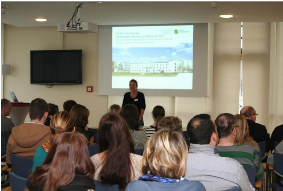
Abbildung 9 Infoveranstaltung zum Auswahlverfahren