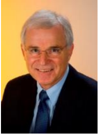
Autor: Werner Schnabel